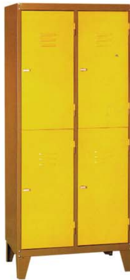
Zerlegbarer Export - Kleiderschrank

Maße Breite: 605mm Tiefe: 500 mm Höhe: 1700 mm