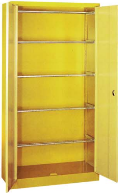
Stahlflügelschrank mit Hängeregistratur

Maße Breite: 1000 mm Tiefe: 400 mm Höhe: 1950 mm