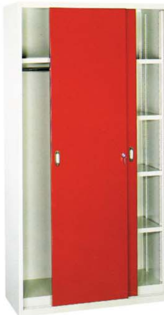
Stahlschiebetürschrank mit Garderobe

Maße Breite: 1000 mm Tiefe: 500 mm Höhe: 1950 mm