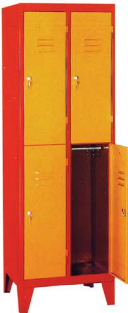
Kleiderschrank mit 2 Türen übereinander

Maße Breite: 605 mm Tiefe: 500 mm Höhe: 1700 mm