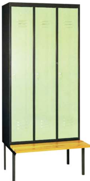
Untergestell mit Sitzbank für Kleiderschränke