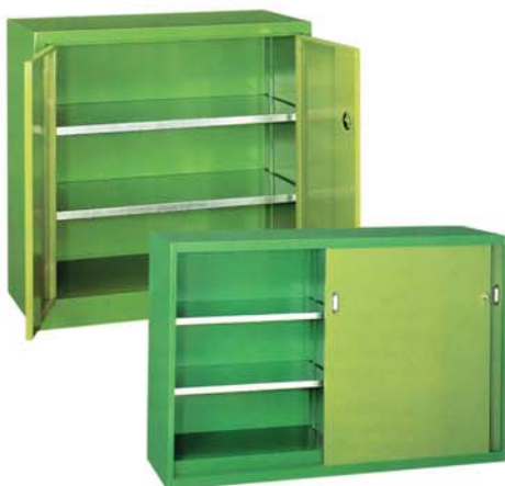
Stahlwerkzeugschrank mit Türen oder mit Schiebetüren

Maße Breite: 1000 mm Tiefe: 500 mm Höhe: 1000 mm