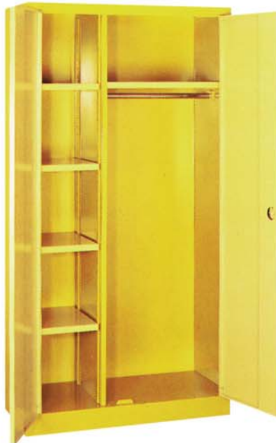
Stahlflügelschrank mit Garderobe

Maße Breite: 1000 mm Tiefe: 500 mm Höhe: 1950 mm