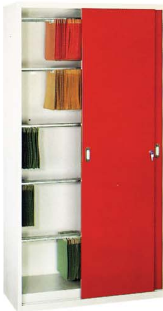
Stahlschiebetürschrank mit Hängeregistratur

Maße Breite: 1000 mm Tiefe: 500 mm Höhe: 1950 mm