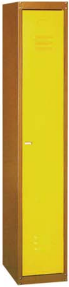
Zerlegbarer Export - Kleiderschrank

Maße Breite: 300 mm Tiefe: 500 mm Höhe: 1700 mm