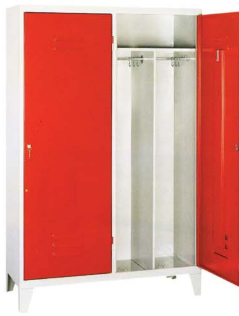
Kleiderschrank mit 1 Tür über 2 Abteilen