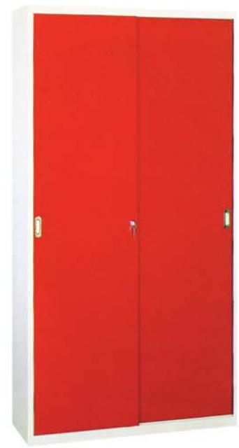
Stahlschiebetürschrank mit Mitteltrennwand

Maße Breite: 1500 mm Tiefe: 400 mm Höhe: 1950 mm