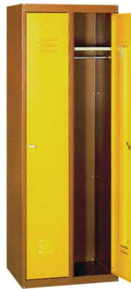
Zerlegbarer Export - Kleiderschrank

Maße Breite: 605 mm Tiefe: 500 mm Höhe: 1700 mm