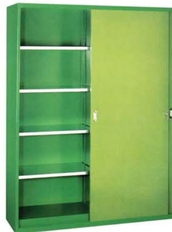
Stahl-Material- Schiebetürschrank mit Mitteltrennwand

Maße Breite: 1500 mm Tiefe: 500 mm Höhe: 1950 mm